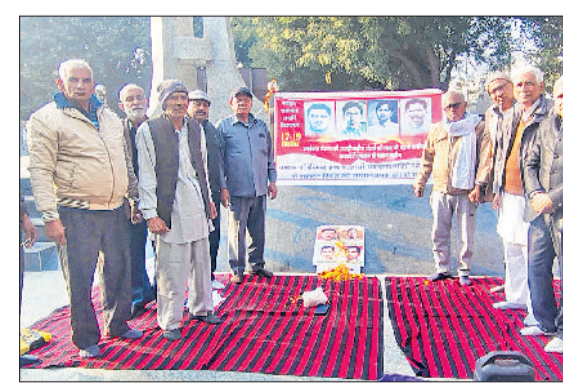
बहादुरगढ़। काकोरी पराक्रम के शहीदों को नमन करते कमेटी सदस्य।