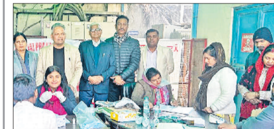
बहादुरगढ़। कैप में कर्मचारियों की जांच करते चिकित्सक।