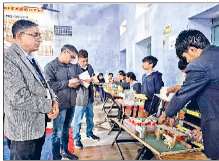
झज्जर। प्रदर्शनी का अवलोकन करते हुए निर्णायक मंडल सदस्य।