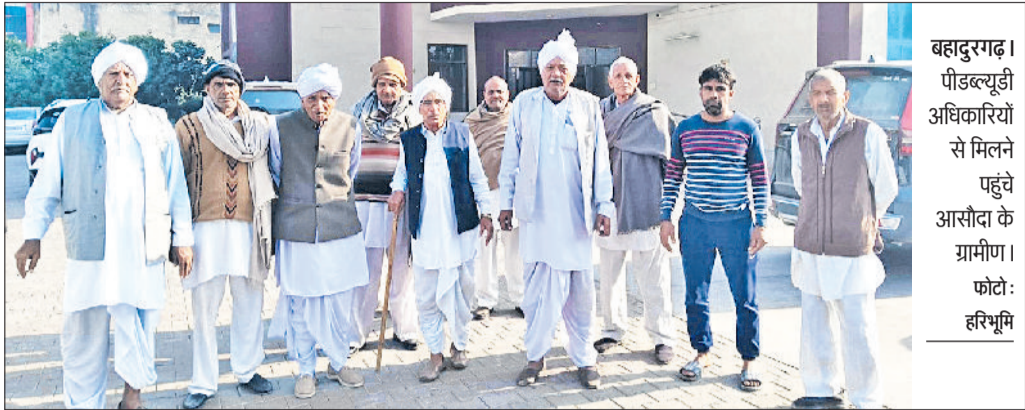
बहादुरगढ़। पीडब्ल्यूडी अधिकारियों से मिलने पहुंचे आसौदा के ग्रामीण।

अभी लड़कों के स्कूल में लग रही कक्षाएं, दो शिफ्ट में चल रहा स्कूल हरिभूमि न्यूज | बहादुरगढ़