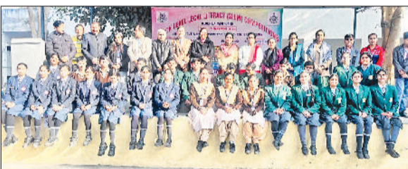
बहादुरगढ़। प्रतियोगिता के दौरान विद्यार्थियों के साथ शिक्षक।

डीएसई पंचकूला के आदेश पर शुक्रवार को राजकीय मॉडल संस्कृति वरिष्ठ माध्यमिक विद्यालय में कानूनी साक्षरता विषय पर खंड स्तरीय प्रतियोगिताओं का सफल आयोजन किया गया। भाषण, कविता, निबंध, वाद-विवाद, गारा लेखन, पेंटिंग, लघु नाटिका, प्रश्नोत्तरी, पावरपॉइंट तथा डॉक्यूमेंट्री फिल्म सहित 10 प्रतियोगिताओं में सरकारी व गैर-सरकारी विद्यालयों के बच्चों ने अपनी प्रतिभा का प्रदर्शन किया। राजकीय मॉडल संस्कृति विद्यालय बहादुरगढ़ ने लघु नाटिका