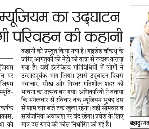
बहादुरगढ़। आगंतुक का स्वागत करते अधिकारी व कर्मचारी।

हरिभूमि न्यूज | बहादुरगढ़ मेट्रो की यात्रा को समर्पित दिल्ली मेट्रो म्यूजियम का शुक्रवार को सुप्रीम कोर्ट मेट्रो स्टेशन पर शुभारंभ हो गया। उद्घाटन के पहले दिन म्यूजियम में आने वाले आगंतुकों का फूलों और स्मृति-चिह्नों के साथ स्वागत किया गया। म्यूजियम में क्यूरेटेड डिस्प्ले और आकर्षक प्रदर्शनों के माध्यम से दिल्ली मेट्रो के विकास, तकनीकी नवाचारों तथा परिवहन व्यवस्था की कहानी को प्रस्तुत किया गया है। गाइडेड वॉकथ्रू के जरिए आगंतुकों को मेट्रो की यात्रा से रूबरू कराया गया है। वहीं इंटरैक्टिव गतिविधियों में लोगों ने उत्साहपूर्वक भाग लिया। इससे उद्घाटन दिवस नवाचार, सीख और निरंतर गतिशील शहर की भावना का उत्सव बन गया। अधिकारियों ने बताया कि मंगलवार से रविवार तक म्यूजियम सुबह दस से शाम चार बजे तक खुला रहेगा। वहीं सोमवार व सार्वजनिक अवकाश पर बंद रहेगा। प्रवेश के लिए मात्र दस रुपये की फीस निर्धारित की गई है।