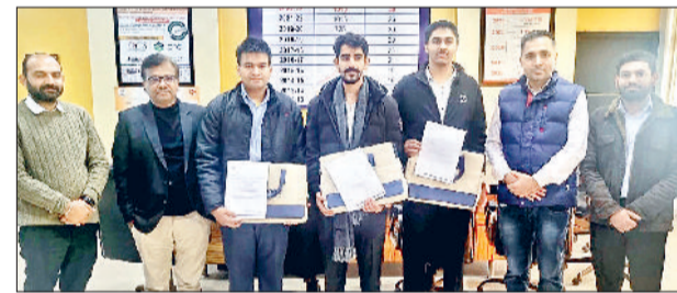
झज्जर। शिक्षकों के साथ उपस्थित चयनित विद्यार्थी।