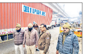
बहादुरगढ़। टिकरी बॉर्डर पर वाहनों को जांचते दिल्ली पुलिसकर्मी।

लंबी कतारें लग गईं और दिन भर जाम जैसी स्थिति बनी रही। खासकर मालवाहक वाहनों और निजी कार चालकों को भारी परेशानी का सामना करना पड़ा। दिल्ली पुलिस द्वारा वीरवार की भांति शुक्रवार को भी 5 वाहन चालकों के चालान काटे गए थे। कई वाहन