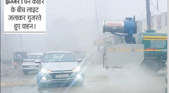
झंझर। घने कोहरे के बीच लाइट जलाकर गुजरते हुए वाहन।

ठंड अपने पूरे चरम है। शुक्रवार को दिन की शुरुआत घने कोहरे के साथ हुई। जिसके चलते सड़कों पर वाहन रंगते हुए दिखाई दिए। बाहरी क्षेत्रों में दृश्यता बीस से तीस मीटर तक ही रही, जिसके चलते सुबह 11 बजे तक चालकों ने अपने वाहनों की लाइटें जलाए रखीं। सुबह 11 बजे के बाद धुंध कुछ कम हुई और आसमान में हल्की धूप निकली। लेकिन धूप निकलने के बावजूद ठंड से राहत नहीं मिल सकी। लोग अपने घरों में दुबकने को मजबूर रहे।