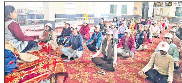
बहादुरगढ़। कार्यक्रम में ध्यान लगाती स्वयंसेविकाएं।