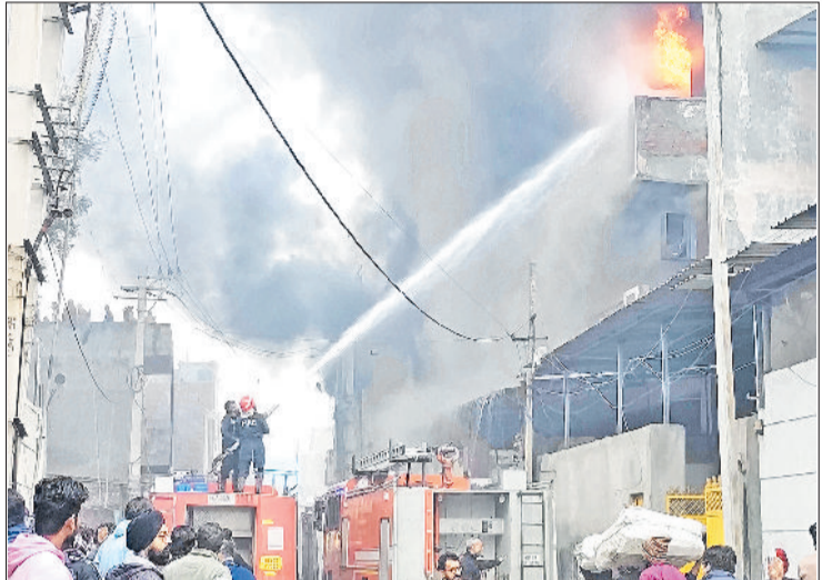
बहादुरगढ़। एमआईई पार्ट ए में शुक्रवार सुबह फैक्ट्री में आग लगने के बाद उदती लपटें व धुआं तथा आग बुझाने का प्रयास करते दमकल कर्मी।